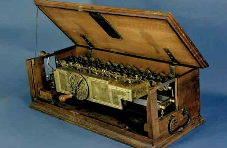
Einzig erhaltenes Original einer der großen Leibnizschen Vier-Spezies-Rechenmaschinen mit Staffelwalzen

besonders mit Preußens erster Königin Sophie Charlotte und deren Mutter Sophie, Kurfürstin in Hannover. Er ist dort oft- und gern gesehener Gast, sei es in Charlottenburg, sei es in Herrenhausen.